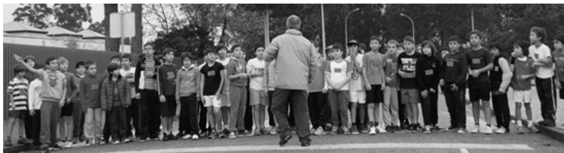
Partida dos Infantis A masculinos

No dia 18 de dezembro, realizou-se mais um Corta-Mato Escolar . Esta atividade contou com a participação de aproximadamente 300 alunos, distribuídos por 5 escalões. Os professores de Educação Física tiveram ainda a colaboração de 30 alunos no apoio à organização. Os vencedores dos vários escalões foram os seguintes: