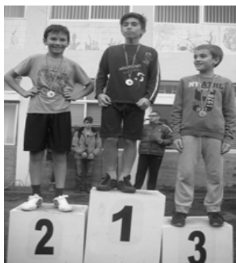
Infantis A masculinos