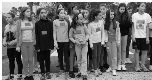
Partida dos Infantis Femininos