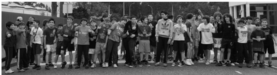
Partida dos Infantis B masculinos