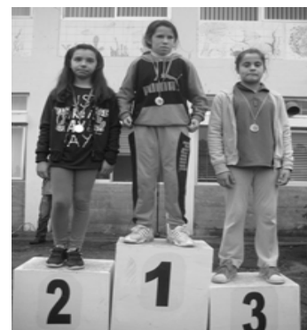
Infantis A femininos