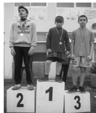
Infantis B masculinos