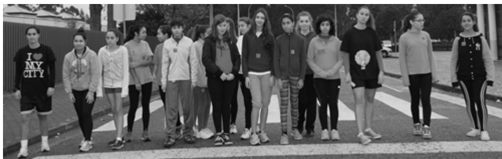
Partida dos Iniciados, Juvénis e Junióres Femininos