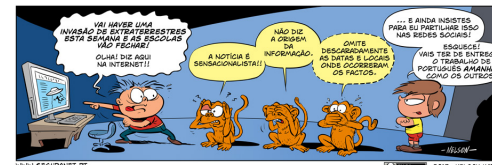
Os macacos sábios das notícias falsas