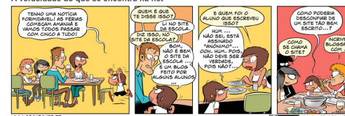
A veracidade do que se encontra na net

Se temos dúvidas sobre a informação que recolhemos, devemos aplicar o nosso bom senso. Na dúvida, devemos perguntar sempre a um professor ou aos pais de modo a confirmar as fontes e/ou a fiabilidade da informação.