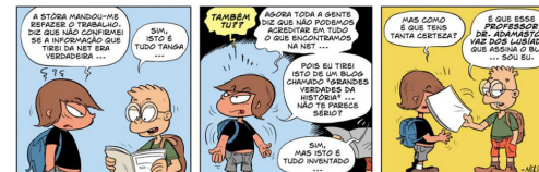
Grandes verdades da História

Os utilizadores devem ter consciência da existência de notícias falsas. Assim, devemos ser críticos antes de partilhar as informações. Se uma notícia foi partilhada muitas vezes, isso não quer dizer que esta informação seja verdadeira.